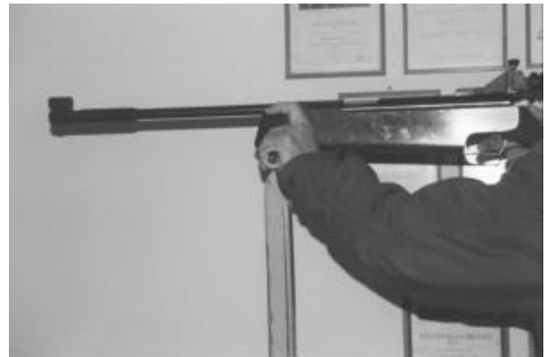
Abbildung 2 – Anschlag nicht gestattet