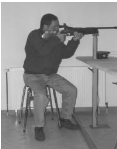
Abbildung 3 Anschlag sitzend aufgelegt

Unter Zuhilfenahme eines Hockers dürfen Teilnehmer ab dem 72. Lebensjahr schießen (siehe Abbildung 3). Die Füße müssen auf dem Fussboden stehen (siehe Abbildung 4). Ein Klammern mit den Füßen ist nicht gestattet (siehe Abbildung 5).