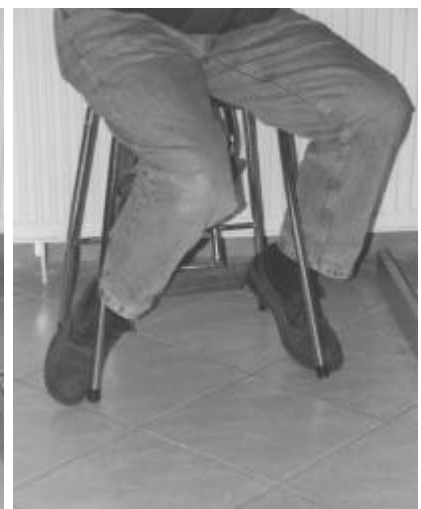
Abbildung 5 nicht gestattete Fußstellung