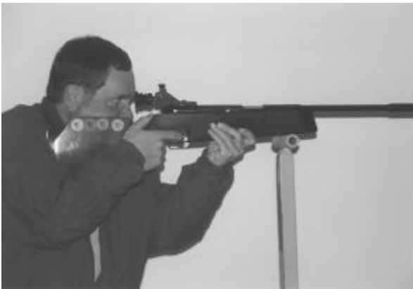
Abbildung 1 – Anschlag stehend aufgelegt

Kein Körperteil darf die Auflage berühren. Das Gewehr darf nur mit der Schäftung aufgelegt, aber nicht seitlich angelehnt werden. Die Stützhand entspricht dem Anschlag stehend Freihand (siehe Abbildung 1). Die Zuhilfenahme sonstiger Stützen bzw. Anlehnen von Körper oder Körperteilen ist nicht gestattet (siehe Abbildung 2). Zwischen Abzugsbügel und Auflage muß ein deutlich sichtbarer Abstand sein.