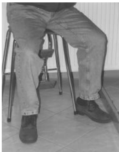
Abbildung 4 korrekte Fußstellung